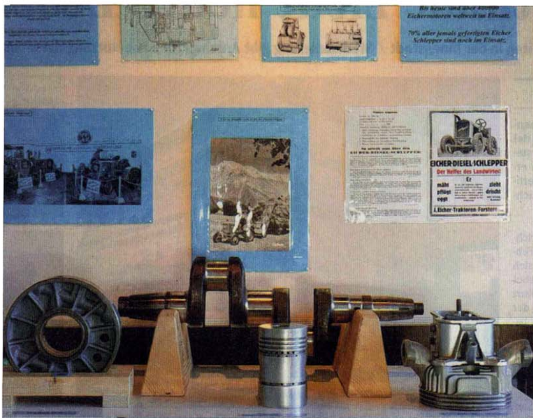
VOM EICHER-MYTHOS, von Nostalgie, Maschinen und Motoren erzählt die Ausstellung des Vereins Eicherfreunde Schwarzwald, die im Kurhaus Schluchsee zu sehen ist. Der Verein feiert in diesem Jahr sein zehnjähriges Bestehen und veranstaltet am 30./31. August ein großes Traktorentreffen in der Seegemeinde.